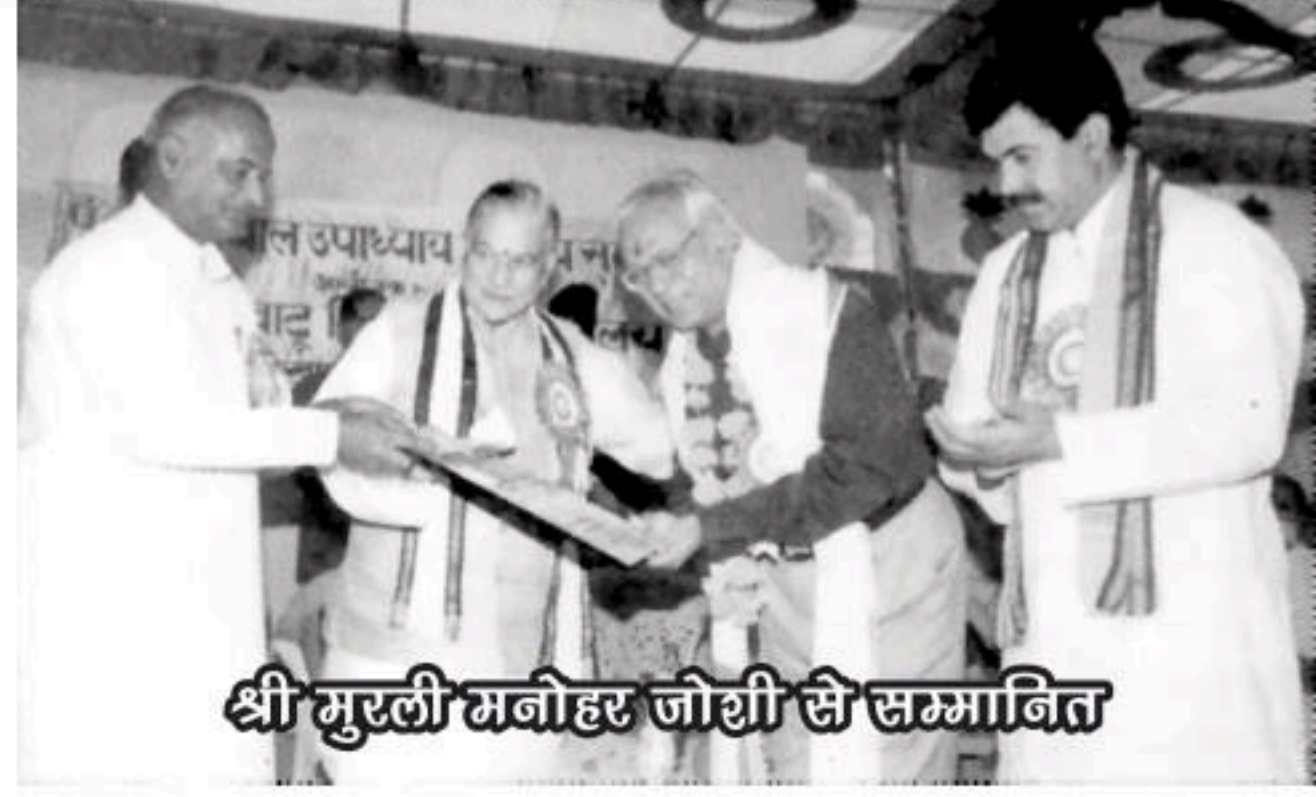
श्री मुरली मनोहर जोशी से सम्मानित

यह सत्य है कि विदेशों में रचा साहित्य जब हिन्दी में 'प्रवासी कहानी', 'प्रवासी उपन्यास' या 'प्रवासी कविता' के रूप में आता है तो वह पाठकों का ध्यान ज्यादा आकर्षित करता है। हिन्दी समाज विदेशों में रहने वाले अपने देशवासियों के जीवन को जानना चाहते हैं, उसे समझना चाहते हैं और स्वाभाविक भी है कि उनके मन में विदेश के प्रति उत्सुकता, जिज्ञासा और ललक बढ़ती है और वह समझने लगता है कि विदेशों में सब कुछ स्वर्ग-तुल्य ही नहीं है। वहाँ का जीवन-संघर्ष कठोर, एकांत एवं काफी अनुशासित है तथा वहाँ डालर पेड़ पर नहीं लगते। उन्हें जीवन को अर्पित करके ही पाया जा सकता है। हिन्दी का प्रवासी साहित्य भारतीय पाठकों को प्रवासी जीवन की कठोर तथा भयावह वास्तविकताओं से परिचित कराता है और इसकी भी अनुभूति कराता है कि उपयुक्त ज्ञान और योग्यता से ही जीवन की उच्चता तक पहुँचा जा सकता है। वहाँ प्रवासी भारतीय में पश्चिम और पूर्व का जो द्वन्द्व है तथा एक सर्वथा नई संस्कृति में जीने की जो विवशता है तथा अपनी अस्मिता और अपनी पहचान खो जाने का जो भय है, वह भी हिन्दी पाठकों की अनुभूति का अंग बनता है और वह अपने देश और संस्कृति के प्रति अधिक समर्पित तथा सम्मान का भाव रखता है। भारत के पाठकों के लिए प्रवासी साहित्य का यह योगदान कम नहीं है और यह तभी संभव है जब हम हिन्दी के प्रवासी साहित्य को प्रवासी-साहित्य के रूप में पढ़ें और समझें।