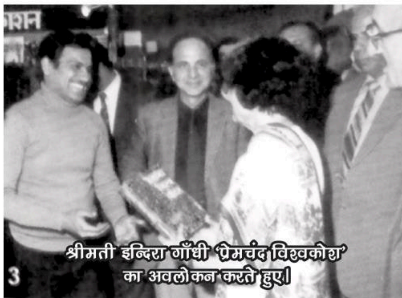
श्रीमती इन्दिरा गाँधी 'प्रेमचंद विखकीरा' का अवलोकन करते हुए।

आपने महत्वपूर्ण प्रश्न पूछा है, परन्तु इसके उत्तर में प्रकृति के सत्य को देखना एवं समझना होगा। आपने स्त्री की शारीरिक कमजोरी को प्रकृतिदत्त माना है कि जो सत्य है। पुरुष की शारीरिक सबलता और स्त्री की शारीरिक दुर्बलता प्रकृति की रचना का परिणाम है अतः इस वास्तविकता को ध्यान में रखकर ही कार्य क्षेत्र तय कर दिया था। पुरुष अपनी शक्ति से भोजन, सुरक्षा आदि का कार्य करता था और स्त्री संतानोत्पत्ति एवं परिवार की रचना करती थी और इस प्रकार मानव-संस्कृति के निर्माण में दोनों एक-दूसरे के पूरक थे। एक और तथ्य पर आप विचार करें- प्रकृति ने पुरुष को आक्रमक (Offensive) तथा स्त्री को सुरक्षात्मक (Defensive) बनाया है। यदि दोनों ही आक्रमक अथवा सुरक्षात्मक होते तो मानव संस्कृति का वर्तमान स्वरूप नहीं होता। अब आपकी बात, प्रकृति में शाक्तिशाली दुर्बल को दबाता रहा है, उसे अपना भोजन बनाता रहा है, लेकिन पुरुष ने संस्कृति के विकास के साथ सीखा है कि स्त्री शारीरिक रूप से कमजोर है तो इसका अर्थ यह नहीं है कि वह अन्य जीवों के समान उसका भक्षण करे, शोषण-दमन करे। यह सच है कि पुरुष अपनी सशक्तता का अनेक बार दुरुपयोग करता है। स्त्री को दासी समझने लगता है और यह भारत में ही नहीं अनेक देशों में होता है, बल्कि मुस्लिम परिवारों में तो स्त्री तलाक के भय के कारण सारा जीवन पुरुष की दासता में निकाल देती है, परन्तु शिक्षा के साथ तथा मानवाधिकार आंदोलन के कारण एवं आधुनिक जीवन की परिस्थितियों के कारण भारतीय पुरुष स्त्री की सत्ता की महत्ता को समझने लगा है और वह सहयोगी व